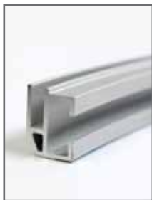
Perfil de alumínio de 20mm