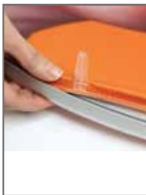
Imagem têxtil com junta de PVC de 3mm opcional